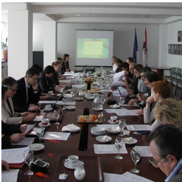
Jedanaesta sjednica Nacionalnog vijeća za razvoj ljudskih potencijala

Preporuke su dostupne na portalu www.kvalifikacije.hr .