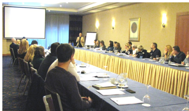
Radionica o vrednovanju standarda zanimanja i standarda kvalifikacija, 9. prosinca 2015.

U srijedu, 9. prosinca 2015., i srijedu, 16. prosinca 2015., u Hotelu International u Zagrebu održane su radionice o vrednovanju standarda zanimanja i standarda kvalifikacija namijenjene članovima sektorskih vijeća. Na radionicama su članovima sektorskih vijeća predstavljani nacrti Smjernica za izradu standarda zanimanja (MRMS) i Uputa za izradu standarda kvalifikacija (MZOS), kao i pripadajući alati, kako bi im se pružio temelj za vrednovanje standarda zanimanja i standarda kvalifikacija, što je jedna od ključnih zadaća svih sektorskih vijeća.