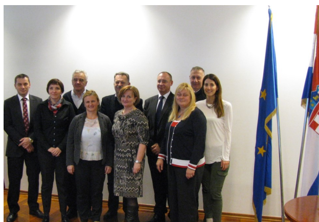
Konstituirajuća sjednica Sektorskog vijeća XI. Promet i logistika