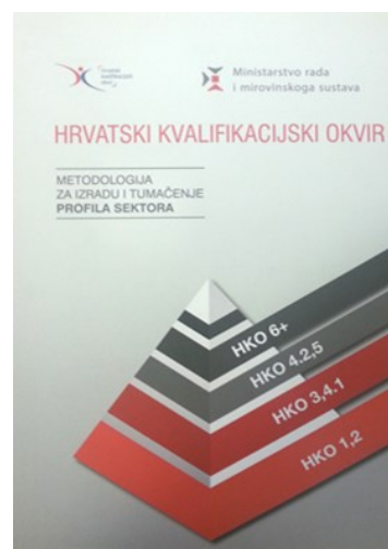
Metodologija za izradu i tumačenje profila sektora

Profili sektora, zajedno s ostalim instrumentima osmišljenim i izvedenim u Ministarstvu rada i mirovinskoga sustava (Anketa o standardu zanimanja, HKO portal, Smjernice za izradu standarda zanimanja, Smjernice za vrednovanje standarda zanimanja), uvelike će pomoći svim zainteresiranim dionicima u postupku izrade kvalitetnih standarda zanimanja i postizanja relevantnosti kvalifikacija s obzirom na potrebe tržišta rada.