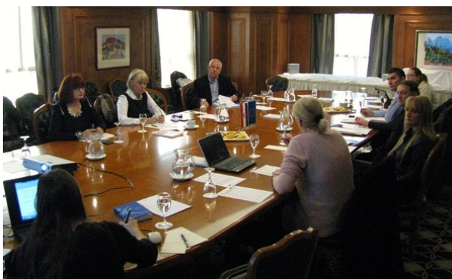
Četvrta sjednica Sektorskog vijeća XXI. Odgoj, obrazovanje i sport

U četvrtak, 3. prosinca 2015., u Hotelu Sheraton u Zagrebu održana je Četvrta sjednica Sektorskog vijeća XXI. Odgoj, obrazovanje i sport . Na sjednici je nastavljena izrada popisa zanimanja u sektoru Odgoj, obrazovanje i sport temeljenog na analizi aktualnih popisa, a započeta je i usporedba izrađenog popisa s popisom pojedinačnih zanimanja u Nacionalnoj klasifikaciji zanimanja (NKZ-u). Iz usporedbe su proizašli prvi prijedlozi promjena u postojećem popisu zanimanja u NKZ-u, a dio zanimanja u NKZ-u određen je kao primaran, odnosno sekundaran za sektor. Radom na prijedlozima promjena u postojećem popisu zanimanja u NKZ-u, kao i podjelom zanimanja na primarna i sekundarna za sektor, članovi su se bavili i na Petoj sjednici Sektorskog vijeća XXI. Odgoj, obrazovanje i sport , održanoj u petak, 18. prosinca 2015., u Hotelu International u Zagrebu.