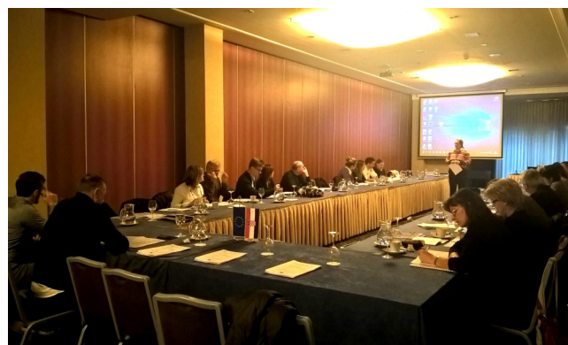
Radionica o vrednovanju standarda zanimanja i standarda kvalifikacija, 16. prosinca 2015.

Održavanje sjednica i radionica sektorskih vijeća omogućeno je u okviru provedbe projekta „Potpora radu HKO Sektorskih vijeća i ostalih dionika u procesu provedbe Hrvatskoga kvalifikacijskog okvira”.