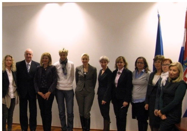
Konstituirajuća sjednica Sektorskog vijeća IX. Ekonomija i trgovina

Na konstituirajućim sjednicama članovima sektorskih vijeća predstavljen je Poslovnik sektorskih vijeća, koji je donio ministar znanosti, obrazovanja i sporta uz suglasnosti ministra rada i mirovinskoga sustava i ministra regionalnoga razvoja i fondova Europske unije. Također, članovima Sektorskog vijeća IX. Ekonomija i trgovina predstavljen je profil podsektora Trgovina izrađen u okviru projekta „Jačanje institucionalnog okvira za razvoj strukovnih standarda zanimanja, kvalifikacija i kurikuluma” (IPA), a članovima Sektorskog vijeća XI. Promet i logistika rezultati rada strukovnog Sektorskog vijeća za promet i logistiku (imenovanog Odlukom temeljenom na čl. 16. Zakona o strukovnom obrazovanju, NN br. 30/09). Na temelju prezentacija povele su se rasprave o aktualnim problemima u pojedinim sektorima. Nadalje, u skladu sa zadaćama sektorskih vijeća propisanim člankom 12., stavkom 2. Zakona o Hrvatskom kvalifikacijskom okviru, dogovoreno je da će članovi sektorskih vijeća sudjelovati u izradi preporuka za promjene i unapređenja u Nacionalnoj klasifikaciji zanimanja te su im sukladno tome predstavljeni prvi zadaci. Zadaci su predloženi u okviru planova rada za 2016. godinu koji sadrže i druge aktivnosti, a bit će usvojeni na sljedećim sjednicama.