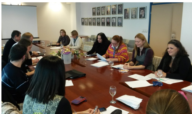
Nacionalna skupina za unapređenje socijalne dimenzije visokog obrazovanja

Ministarstvo znanosti, obrazovanja i sporta imenovalo je Nacionalnu skupinu za unapređenje socijalne dimenzije visokog obrazovanja , koja je 2. studenoga 2015. održala svoj prvi sastanak.